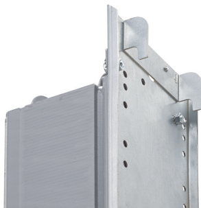
Verstellbarer Haken für flexible Anbringung der ECB330 - IP20 Version