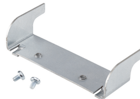
Befestigungsset für ECB330 - IP20 Version