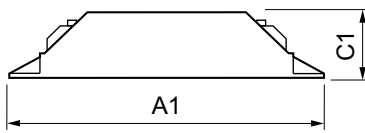
HF-M BLUE 124 LH TL/TL5/PL-L 230-240V