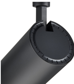
CoreLine Projector gen2 Detail Photo 1 Black