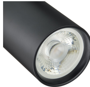
CoreLine Projector gen2 Detail Photo 2 Black