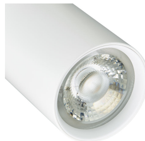
CoreLine Projector gen2 Detail Photo 2 White