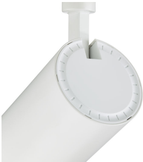
CoreLine Projector gen2 Detail Photo 1 White