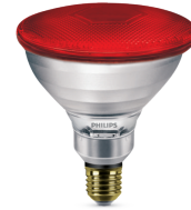
E27, R125, Clear