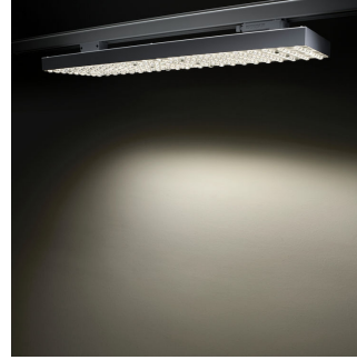
SM500T WB VWB DA20 DA35 Detail photo 17