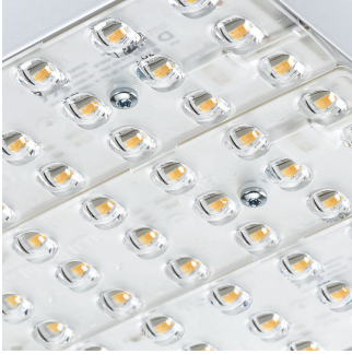
SM500T WB_VWB_DA20_DA35 Detail photo 07