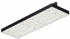
SM500T track luminaire with double asymmetric optic