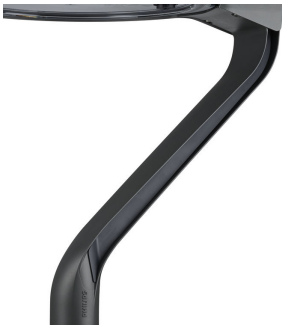
TownTune LYR BDP270