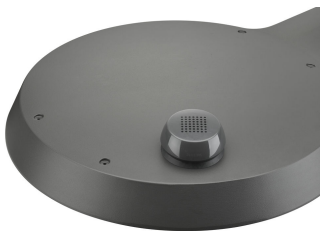
TownTune ASY BDP265