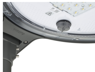
TownTune ASY BDP265