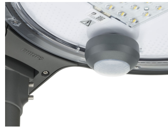
TownTune ASY BDP265