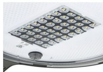
TownTune ASY BDP265