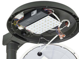
TownTune ASY BDP265